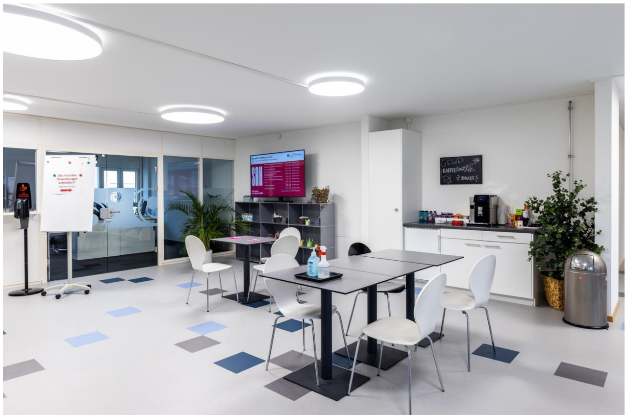
Foyer Bildungszentrum Luzern