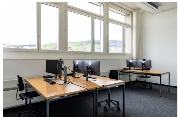
Büroraum 2 und 3