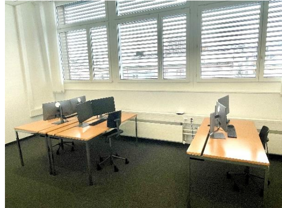
Büroraum 2 und 3