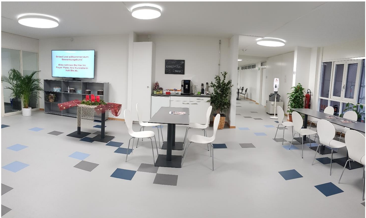
Foyer Bildungszentrum Luzern

Colette Marx Standortverantwortliche SAH-Bildung und Qualifizierung 041 700 60 61 bildung@sah-zs.ch